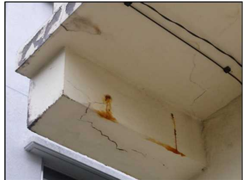
バルコニーにおける鉄筋に沿ったひび割れの例（外壁等剥落危険性）